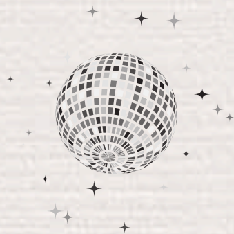
DJ & FOTOGRAF

Bitte legt vorab fest, welche Speisen und Getränke ihr für eure Dienstleister übernehmen möchtet.